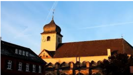
Bork: Kirche / Church St. Stephanus