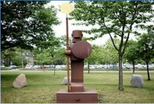
LAFP: Der Wächter / The Gardian