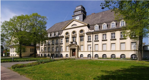
Bork: Amtshaus / District Office