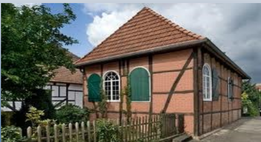
Bork: Jüdische Synagoge / Jewish Synagoge